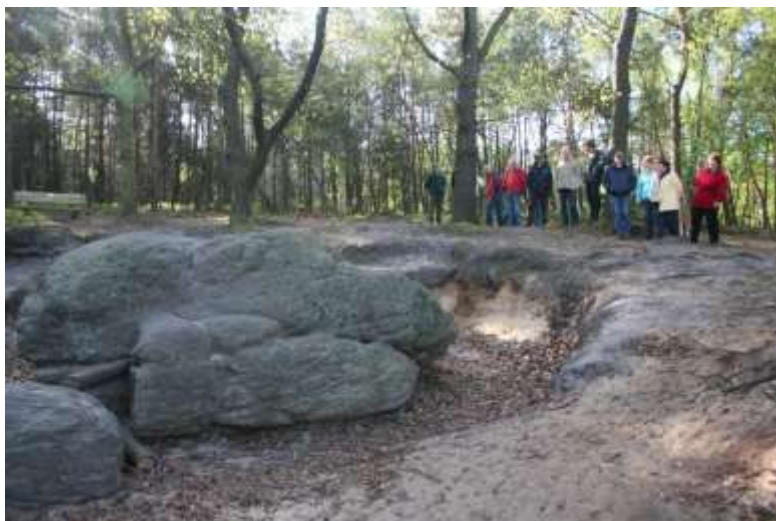
De werkgroep en de Dikke Steen vóór de opruimactie

Eventueel nadere informatie over de Dikke Steen, Landschap Overijssel en Natuurbeheer op de Lemelerberg is te verkrijgen bij de heer Dijkstra van Landschap Overijssel, telnr. 0529 401731.