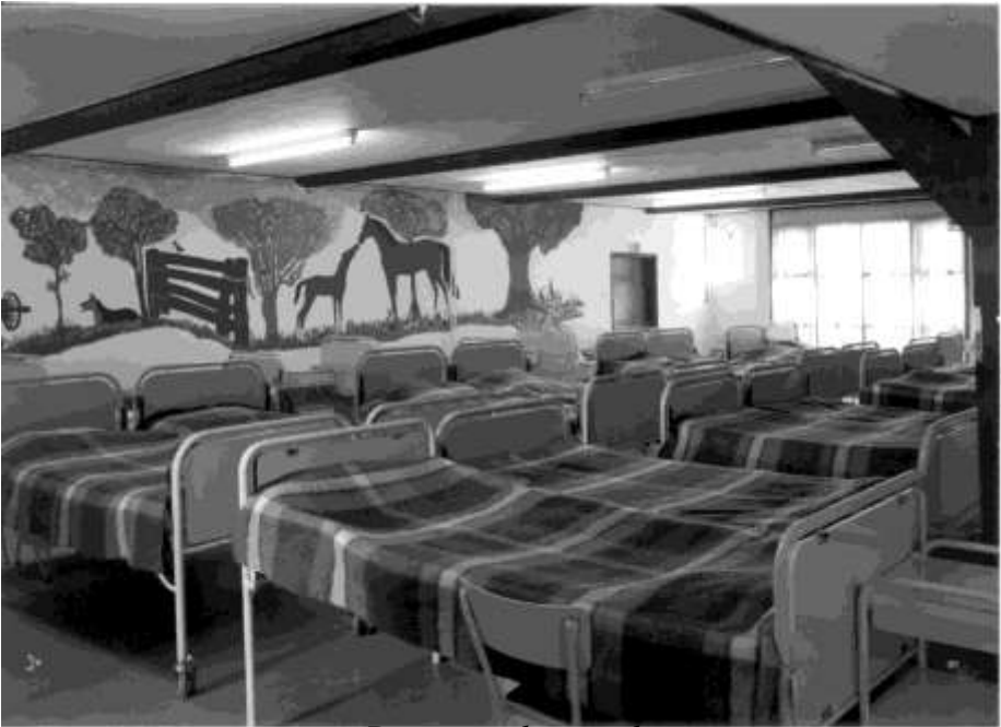
De eerste slaapzaal

De eerste verbouwing die plaatsvindt is de “dele” en die te verbou-