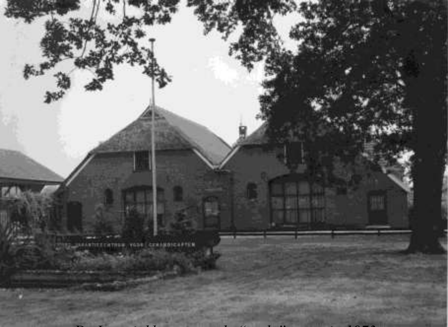
De Imminkhoeve met de “oude” naam in 1973

Hier komt een geheel nieuw gebouw “de Schaapskooi” te staan, die plaats biedt aan 16-gasten.