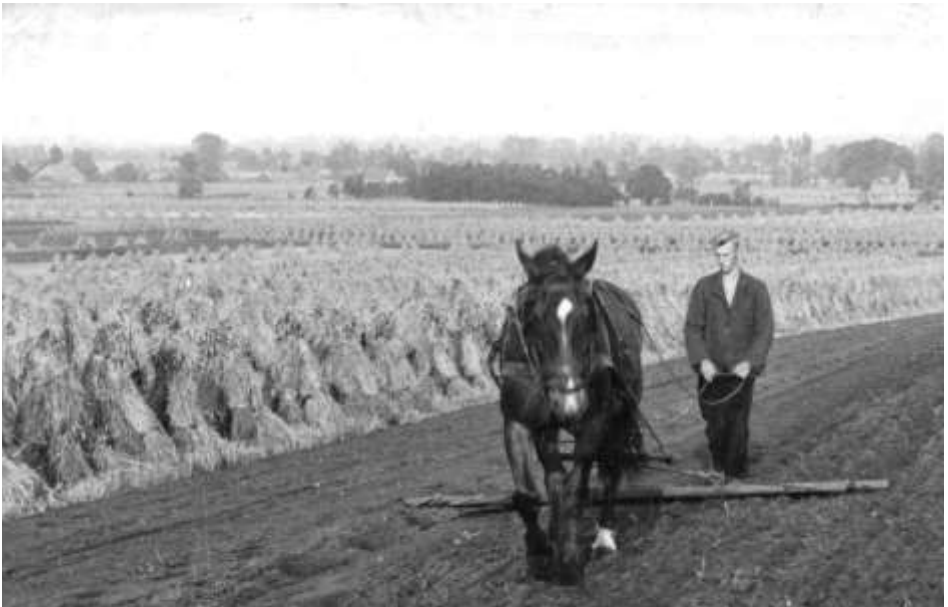
Het eggen van het land ingezaaid met spurrie