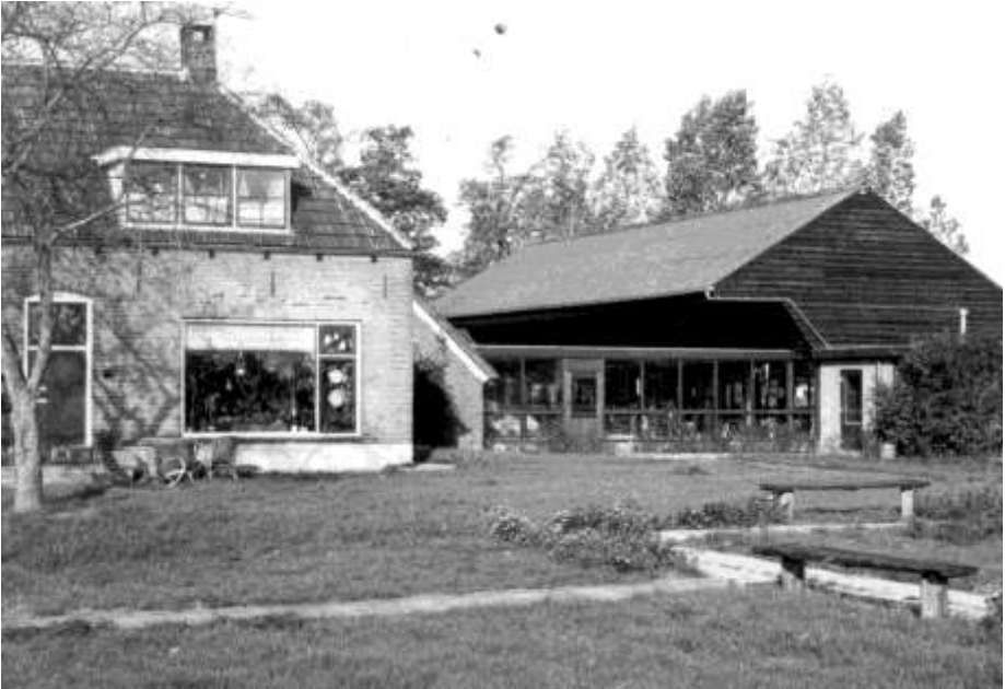
Zo zag het er nog uit in 1973 aan de achterkant

De Rotaryclub uit Ommen biedt een midgetgolfbaan aan. De vriendenclub wordt uitgebreid met een afdeling in Lemele en in Dalfsen. Zij zorgen er voor dat er een nieuwe rolstoelbus gekocht kan worden. Doordat er steeds meer groepen hun vakantie op de Imminkhoeve willen doorbrengen besluit het bestuur in 1995 uit te zien naar een locatie op een andere plaats. In 1996 wordt van de Larcom een gebouw gekocht bij het station in Ommen. Dit gebouw wordt verbouwd