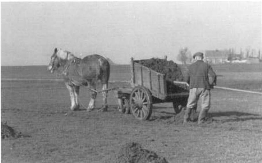
Mest uitrijden op het land