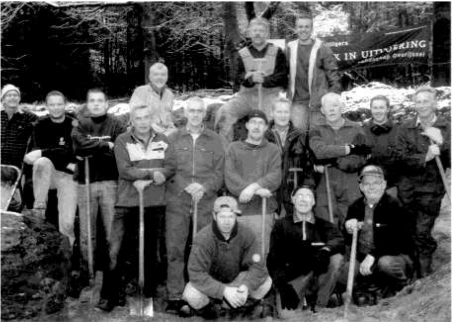
Het vermoeide spitteam aan het eind van de ochtend