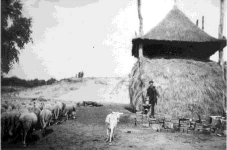
Achter het erf stond deze hooiberg. Duidelijk zijn de zandbelten te zien. (Foto gemaakt in de richting Archem)