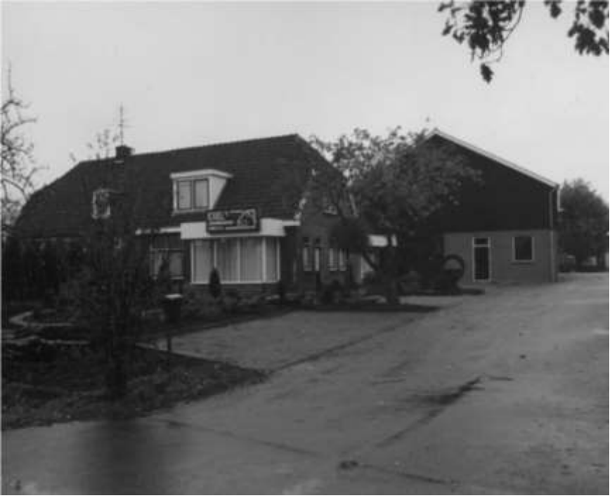
Het bedrijf in 1975

zowat onder de bouwmaterialen. In 1978 werd dit gerealiseerd en werd het bedrijf meteen omgezet in een B.V. : Exel's Aannemingsbedrijf Lemele B.V. 1979 werd een jaar om nooit te vergeten. Door subsidie van de overheid kreeg elke boer de drang om te investeren. In de regio Hardenberg kreeg hij wel 48% subsidie op de bouwkosten. De achterliggende gedachte van de overheid was op die manier de werkgelegenheid uit te breiden. Het aantal toen gebouwde ligboxenstallen was meer dan één per productieweek en dit terwijl andere projecten gewoon door moesten blijven gaan. Een tijd om snel te vergeten, want het was niet allemaal even leuk. Vooral omdat na deze periode ( in de jaren 80) de bouw terugliep en er moest worden ingekrompen. Gedane investeringen zetten de algemene kosten toen behoorlijk onder druk. Door Exel's bekendheid in de stallenbouw werd het rayon steeds groter, waardoor afstanden van 70 km. regelmatig werden gemaakt om aan het werk te blijven. Daarnaast was er het probleem van de schoolverlater: weinig werk, dus veel werkloosheid en te geringe vakopleiding. Zodoende werd in 1983 het samenwerkingsverband