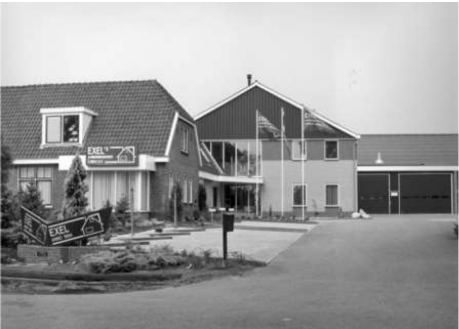
Exel's Aannemingsbedrijf Lemele BV