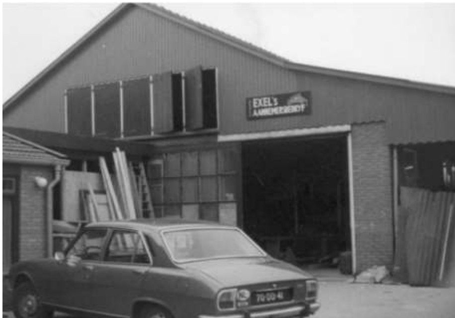
Exel's Aannemersbedrijf ± 1970

In de jaren 70 breidde Exel zich vrij snel uit. In 1973 werd samen met de Bimo, Weelink en OCB de Ommer Bouwcombinatie opgericht om gezamenlijk grond te verwerven voor de bouw van woningen om de logische terugval van de winterperiode te kunnen overbruggen. Binnen dit verband bleef elk bedrijf wel zelfstandig opere-