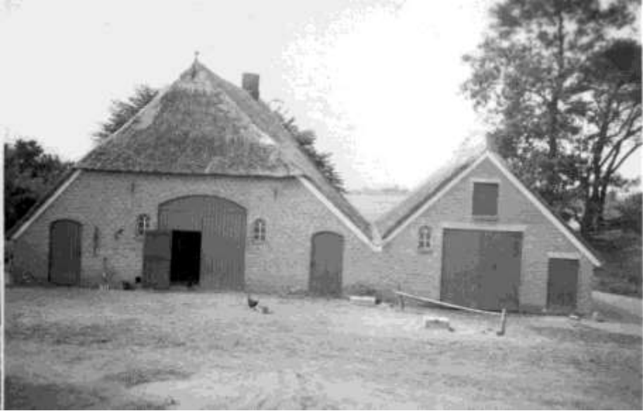
Erf Ekkelkamp met rechts de potstal. De foto is genomen in de richting van Lemele.

De huidige bewoners zijn Herman en Dinie Ekkelkamp met hun vijf