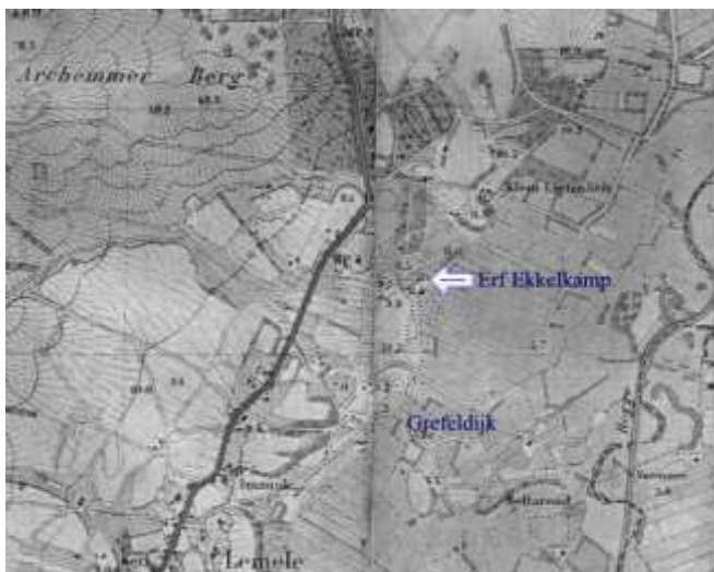
Kaart 1924 met Erve Ekkelkamp

foto is rechts van de stal een potstal te zien. Deze is in de zestiger jaren afgebroken. Hier loopt nu de huidige Doornsteeg, maar het huisadres is nog steeds Nagelweg. De Nagelweg is nog dat stukje van de oude zandweg, dat nu aan de overkant van de