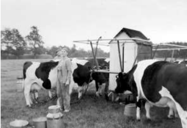
Elsje bij de melkmachine in het land

Om aan de paardenvordering te ontkomen was er achter de boerderij een ondergrondse stal gebouwd. Ook daar vonden onderduikers vaak voor één nacht onderdak. Soms werden de boeren verplicht om voor de Duitsers te werken of zaken te vervoeren. Zo moest Jan Hendrik Grondman een vracht wegbrengen met paard en wagen. Naar Zuid-