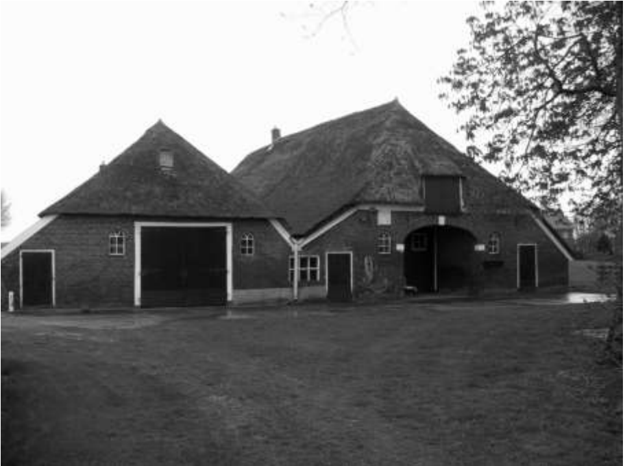
Links de potstal, rechts de grupstal