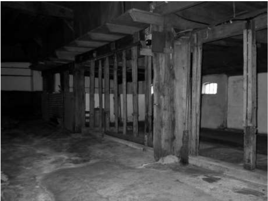
Stal met reppels

Na de herfst als de koeien op stal gingen werden ze in de grupstal vastgezet. Eerst werden ze vast gezet aan houten 'reppels'. Dit zijn ronde palen die stonden op de grond vast in de 'zul', een verhoogde