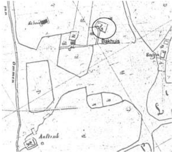
Tussen de School en het erf Soogen ligt het erf Bakhuis (Kadastrale kaart 1832)

De grens begon ongeveer tussen de erven Bakhuis en Voortman (de berenhouder) en liep over de Lemelerberg richting Lovenseweg in Dalmsholte. Het erf is al ingetekend op een land- en ook op een kaart van 1883.