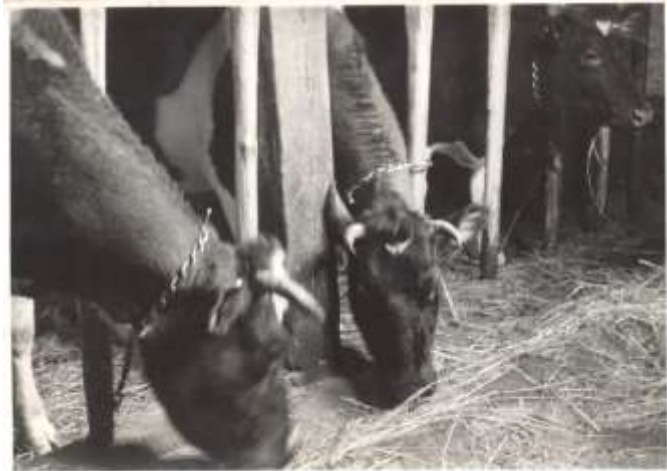
Koeien aan de reppel