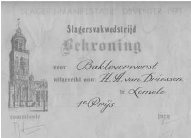
1e prijs bakleverworst