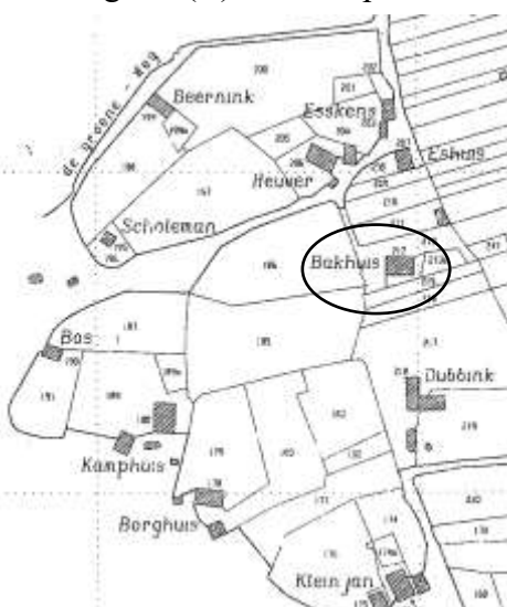
Deel van Kadastrale kaart 1832 van de Daarler Esch Zuideinde