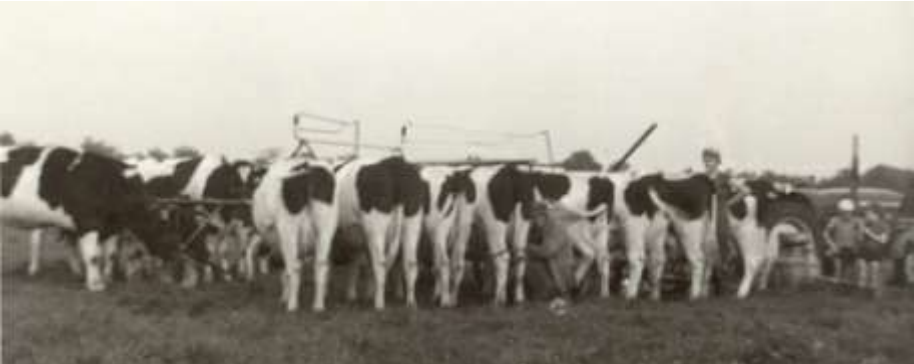
Melken met de machien

Op het bouwland werden producten verbouwd die ook als voer voor de koeien gebruikt konden worden zoals bieten, haver, rogge en knollen. Pas veel later kwam de maïs. De bieten waren niet meer zo geschikt voor het vee. Ook werd er veel gras ingekuuld, persvoer ofte wel 'pasvoer' en dit zat dan in de 'paskoele'. Dit werd 's winters gevoerd op stal, naast hooi en krachtvoer. De meeste koeien bij de Fam. Stoeten hadden namen als Janke 1, Janke 2, Janke 3 en ga zo maar door. Het vaarskalf kreeg dezelfde naam als de moeder met een op-