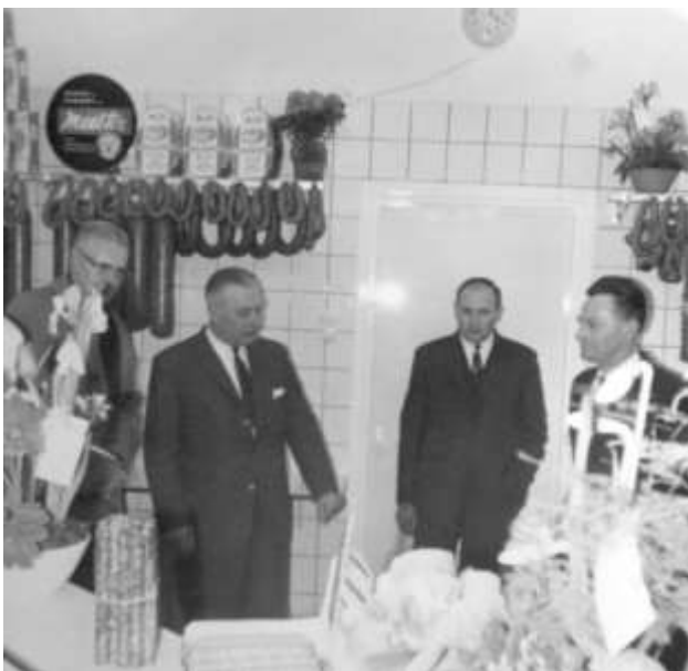
Opening Slagerij van Driessen