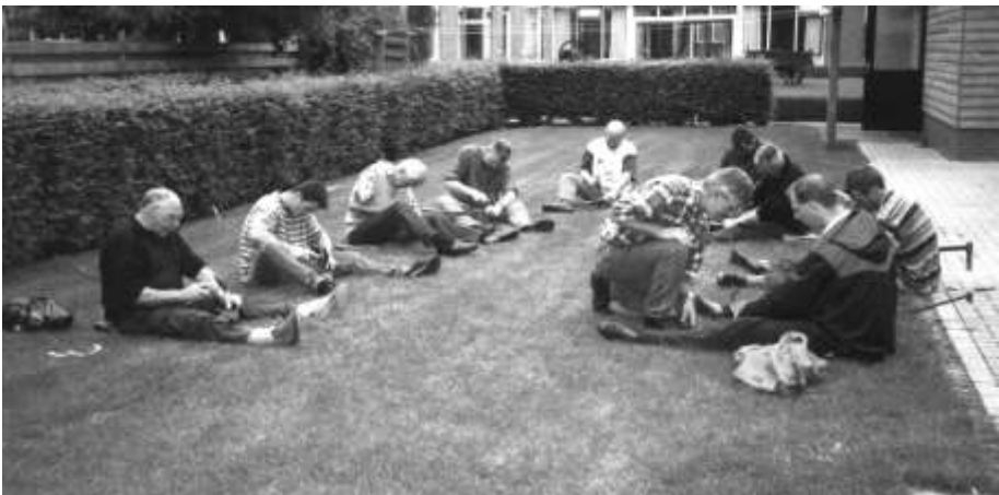
Zeis haren met instructie van Gerrit Smienk

Eind juli kon de zeis getest worden op scherpte. Bij de familie Vos aan de Huusminksteeg stond nog een stukje gras wat hun paarden toch niet lusten; daar konden ze zich flink op uitleven. Er werd heel wat keren in de lucht gemaaid of plaggen gestoken. Na afloop smaakte de koffie met krentenwegge natuurlijk uitstekend.