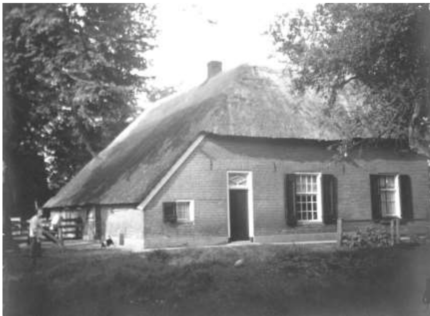
Boerderij Erve Dakhorst met links Mina

klompje voor om de tol te vangen. Op een dag kwam er een Duits schip langs en deze schipper sneed het touwtje door.