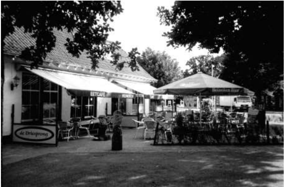
Café met terras na de laatste verbouwing

"Wilt u nakaarten over de wedstrijd of training iedereen heeft bij "de Driesprong" een andere mening"