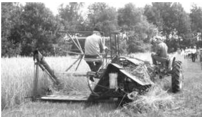
Lemeler Oogstdag 2002: maaien met zelfbinder

Als de oogst gedaan was, was het feest: Stoppelhanen of Stoppel-