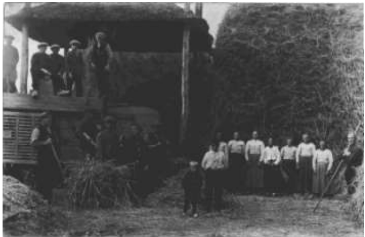
Dössen bij Klein Hors- man 1925

dan stiet Jan doar toch te knooien en te dreien, hé dut zo gek, stiet hoaste as een haene te kreien. Mar as blik dat der een moes in zien bokse is eslöpen die langs de bene zo mar noar boam is ekröpn, hebt de lue geweldig völle wille, al hoalt ze zich eam wieselijk stille. As het muussie begint te knabbelen onverwacht, bäst ze uut in een bulderend gelach. En wanneer het noa die consternatie is evangen is de koffie met stoete van groot belang. Doarumme stieffelt ze eers noar de kökn woar ze de koffie al lange hebt erökn. Zie valt hongurig op de witte stoete met keeze en vleis en loat zich vaste niet neung zo iedereis. Deur de sterke verhaaln met humor deurspekt, davert de lachsalvo's van tied tot tied deur 't vertrek. Mar as Bäts een schöffie laeter de kökn verlöt, ok met gaank in zien eing klompen schöt, märkt hé det et niet goed lukt, umdet der veurin beheurlijk wat drukt. Dan hölt e triumfantelijk de moes bie de stät, die Jan stiekem in zien klompn edrukt had.