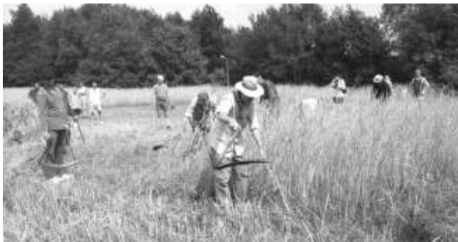
Lemeler Oogstdag 2002: maaien met de zicht

schoven tegen elkaar te zetten, zodat het graan kon nadrogen. Eerst twee tegen elkaar en vervolgens steeds twee er tegenaan. Met een laatste garve werd het hok of de schoof dichtgezet. Samen vormden ze