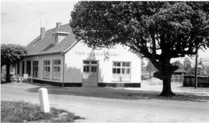
Café "de Driesprong"

In 1960 vindt er een grote verbouwing plaats. De deel wordt bij het café getrokken en het rieten dak wordt een pannendak. Werd tot dan toe het café aangeduid als "Café Voortman", vanaf toen werd de officiële naam: café "de Driesprong". Het café lag namelijk aan de doorgaande weg Ommen-Hellendoorn, met als scherpe afsplitsing de weg naar Lemelerveld.