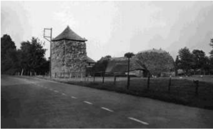
De grote kapberg bij Koers aan de Lemelerweg, rechts daarvan de schaapskooi en daarachter een roggemiete. Het huis is te zien tussen de kapberg en de schaapskooi.

Wederom met drank en boerendans werd het binnenhalen van de oogst gevierd. In de volksverhalen heeft de roggehaan overigens nog een andere betekenis. Kinderen moesten het uit hun hoofd laten om